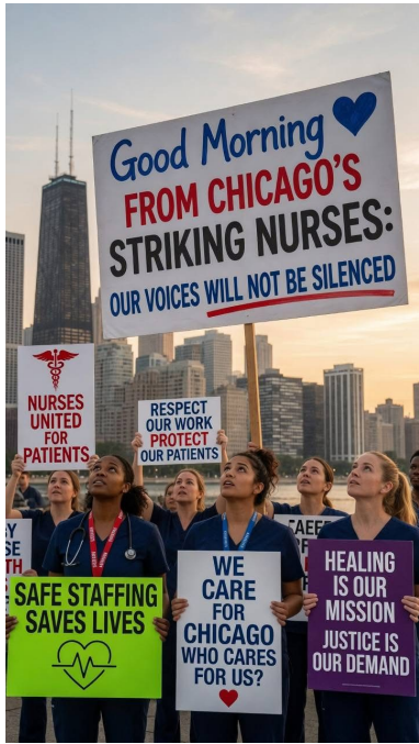
ストライキするシカゴの看護師

最近「超過勤務申請ができない」、「しにくい」と言った相談が増えています。そこで今回は、超過勤務申請についての基礎知識を整理します。正しい知識があれば、自信をもって超過勤務申請することができます。